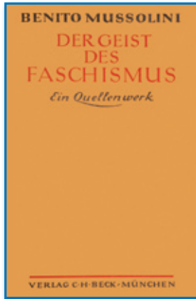
Benito Mussolini: Der Geist des Faschismus

Dies bedeutet im Umkehrschluss, dass der Faschismus im strikten Sinne auch den Nationalsozialismus letztlich als eine Abart des liberalen Materialismus ansehen muss – eben als sein il-liberales Geschwisterkind. Ein Materialismus, also die Reduzierung des Menschen und seiner wesentlichen Bestimmungsmomente auf die (biologische) Materie, bleibt bei ihm wie im Liberalismus bestehen. Im Unterschied hierzu hebt Gentile hervor, dass der Faschismus an „die Macht der idealen Prinzipien“ glaube und sich die Nation „im Geist verwirklicht“ – und eben nicht im „Blut“ (ebd.: 43).