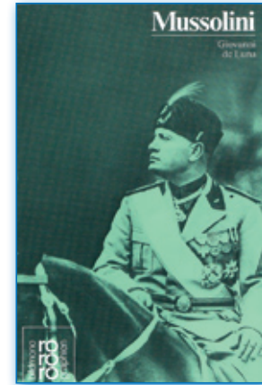
Giovanni de Luna: Mussolini

demokratische Dekadenz.“ (ebd.: 45) Darüber hinaus richtet sich der Faschismus aggressiv gegen Liberalismus und Aufklärung und verteuft mit dem Materialismus letztlich auch den wohlstandsorientierten Marxismus. Trotz zahlreicher Sozialreformen gründet der Faschismus seine Identität damit auf eine Form des politischen Mythos, der den totalen Staat und die politische Gewalt in den Vordergrund stellt: „Diese mythische Auffassung von der Politik, oder besser, dieser Glaube an die Macht des Mythos als Triebkraft der Geschichte, ist der Leitfaden der faschistischen Weltanschauung.“ (ebd.: 290)