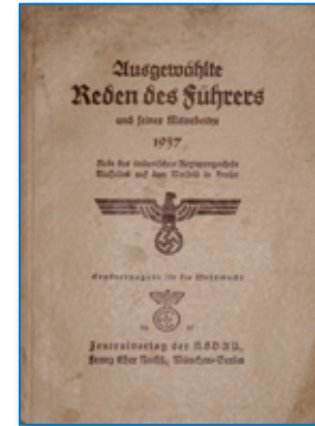
Adolf Hitler: Reden des Führers

anspruch folglich eine Aristokratie der Leistung zu sein, nicht der leistungslosen naturalistischen Selbsteinbildung. Was dieser letztlich anti-intellektualistische „Geist“ jedoch angesichts der Tatsache wert ist, dass er den Vorrang der Tat vor dem Denken proklamiert, auf diese Weise irrationale Leidenschaften zum Taktgeber der Politik erhebt und Gewalt zur „chirurgischen Notwendigkeit“ (ebd.: 81) erklärt, ist freilich eine ganz andere Frage. ■