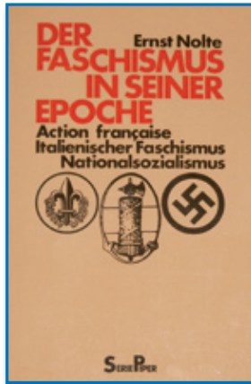
Ernst Nolte: Der Faschismus in seiner Epoche

empfindung Hitlers“ (Mansilla 1971: 108) angesehen werden müsste, die ihn zu den überaus brutalen Vernichtungsprogrammen gegenüber den Juden veranlasst hätte. Den italienischen Faschismus und den deutschen Nationalsozialismus dabei gleichermaßen unter den Begriff „Faschismus“ zu subsumieren, begründete Nolte im Rahmen seines ideologiegeschichtlich ausgerichteten Ansatzes u.a. damit, dass nach seiner Ansicht der Antisemitismus