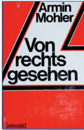
Armin Mohler: Von rechts gesehen