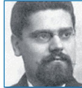
Giovanni Gentile: Philosoph des italienischen Faschismus

Italienischer Faschismus und deutscher Nationalsozialismus waren lange Jahre, insbesondere während des Zweiten Weltkriegs, auf Gedeih und Verderb aneinander gekettet. Von antifaschistischer Seite brachte dies beiden Regimen in der Folge ein, gleichermaßen unter dem Sammelbegriff „Faschismus“ verhandelt zu werden. Allerdings werden über den gemeinsamen militärischen Kampf hinaus weithin auch zahlreiche, vor allem ideologische Differenzen übersehen. Während der Nationalsozialismus das Wesen des Menschen in seiner biologischen Natur verortete und mittels Rassenzüchtung einen „neuen Menschen“ schaffen wollte, stellt der Faschismus als Ideologie den Kampf um den Geist des Menschen in den Vordergrund.