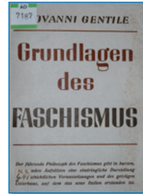
Giovanni Gentile: Grundlagen des Faschismus

Auch wenn der Nationalsozialismus in seinen sozialen Forderungen nicht so weit ging wie der Faschismus, versuchte auch er sich an der „sozialdemokratischen Abfederung“ (Kubitschek 2006: 6) der Massen. Trotz dieser funktionellen Ähnlichkeit bestehen zwischen Faschismus und Nationalsozialismus dennoch gravierende, vor allem