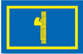
Persönliche Standarte von Benito Mussolini mit den Fasces in der Mitte